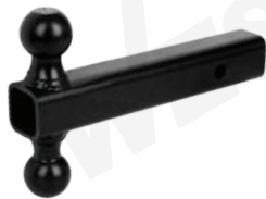
MIN: 1 / CAJA: 4