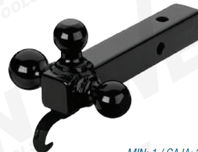
MIN: 1 / CAJA: 2

Mango de 10" Acero sólido Distancia bola grande a perno: 8" Distancia bola chica a perno: 7" Diámetro de perno: 5/8" Para recibidores de 2"