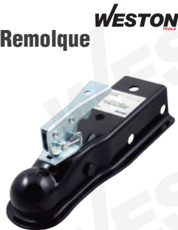
MIN: 1 / CAJA: 10

Se adapta a lenguas de remolque rectas y bolas de remolque de 2" Estos acopladores están diseñados para aplicaciones exigentes