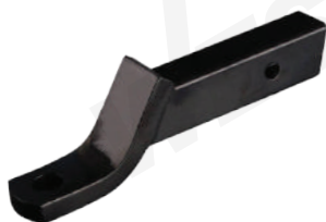
MIN: 1 / CAJA: 6