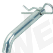
MIN: 1 / CAJA: 25 / MASTER: 100

Brinda seguridad para sujetar la lengüeta al remolque Acero sólido