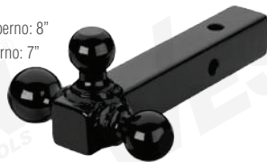
MIN: 1 / CAJA: 2

Mango de 10" Acero sólido Distancia bola grande a perno: 8" Distancia bola chica a perno: 7" Diámetro de perno: 5/8" Para recibidores de 2"